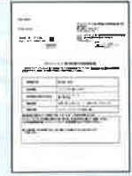
有効期限通知書 ※お忘れでも手続き可能です