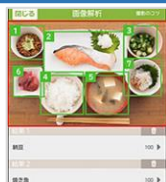
写真1枚ですべての食事を瞬時に解析して 簡単に食事登録ができます。